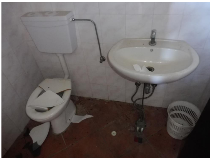
Locale servizi clientela uomini