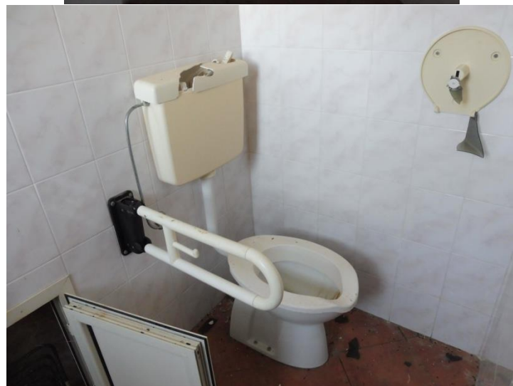
Locale servizi clientela donne