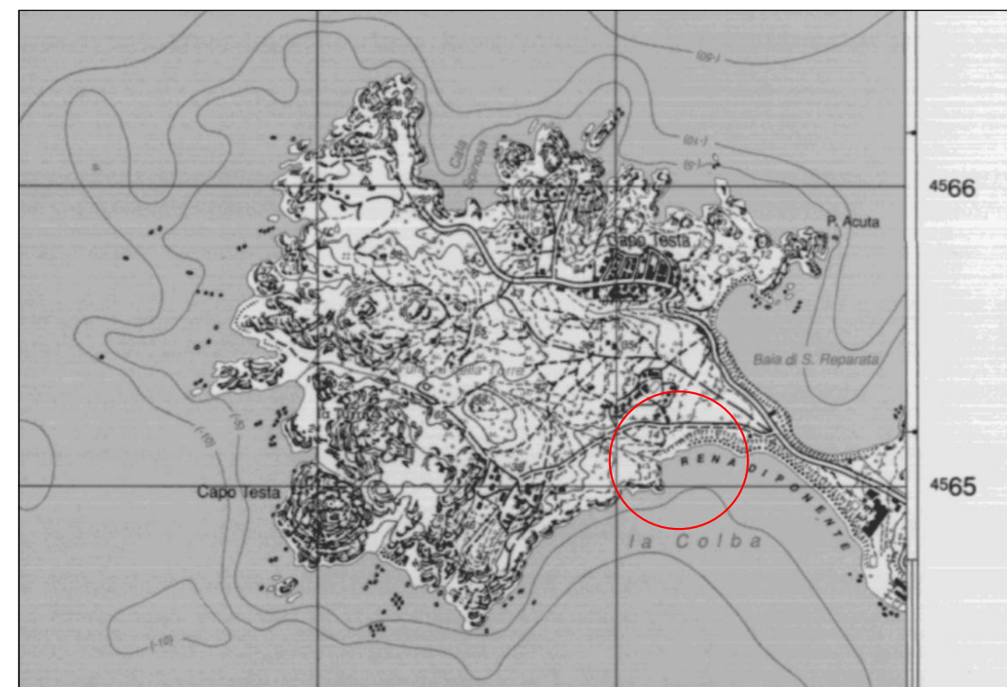
STRALCIO I.G.M. FOGLIO 411 SEZIONE 3 CAPO TESTA