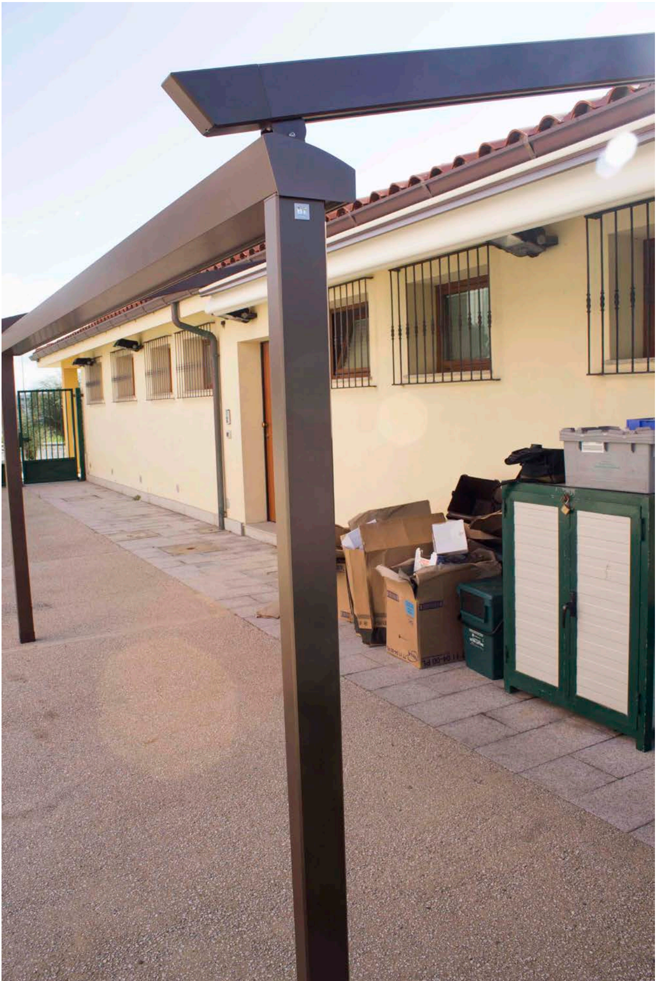
Residenza Municipale: via Capitan Eligio Porcu – 09045 Quartu Sant’Elena (CA) Tel. 070-86012646 • Fax 070-86012290